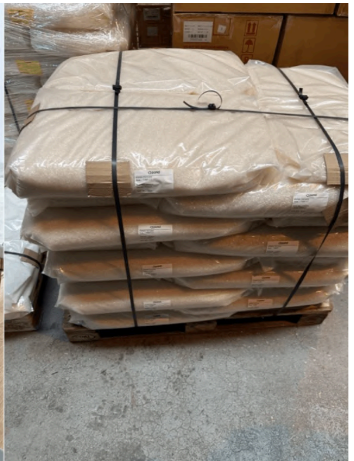
采用亚麻纤维与POND CYCLE粘结剂、并一体成型POND CYCLE加强筋结构的车门内饰板试验件。以咖啡果果肉胶质制成的T恤。THOMAS与精美的丹麦酥点，以及一整托盘POND CYCLE颗粒。