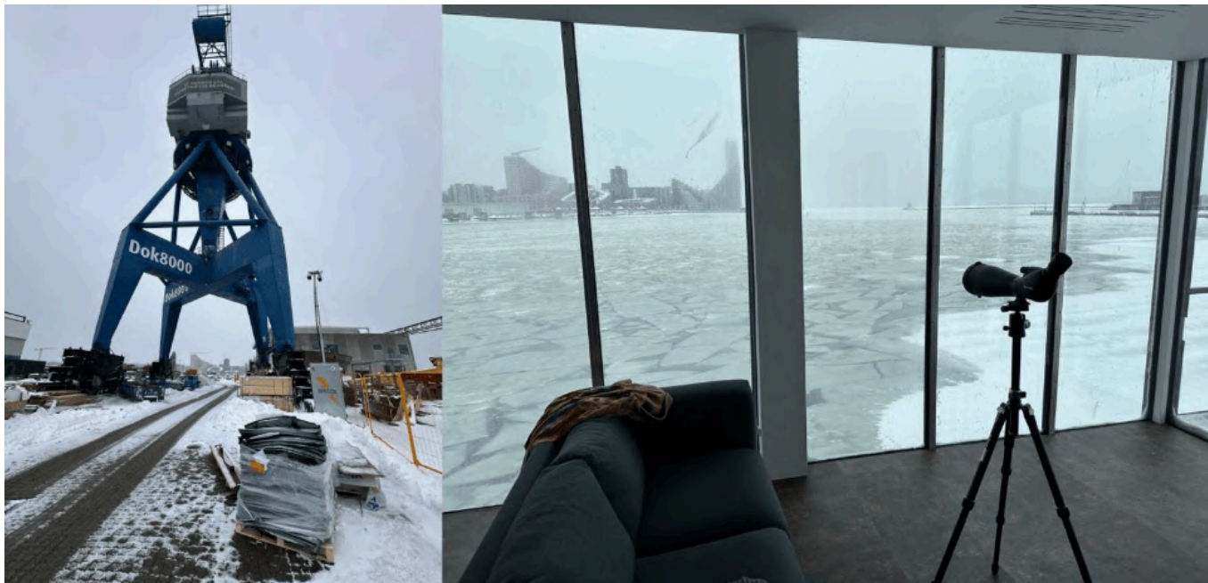
宛如 007 电影的选址——起重机旁的混凝土建筑群，俯瞰着整座港口

这类新型分子能与玻璃纤维、亚麻、大麻、椰纤维、香蕉叶、棕榈叶、草本纤维等多种重要材料形成牢固的共价键结合，其结合强度远优于环氧树脂。