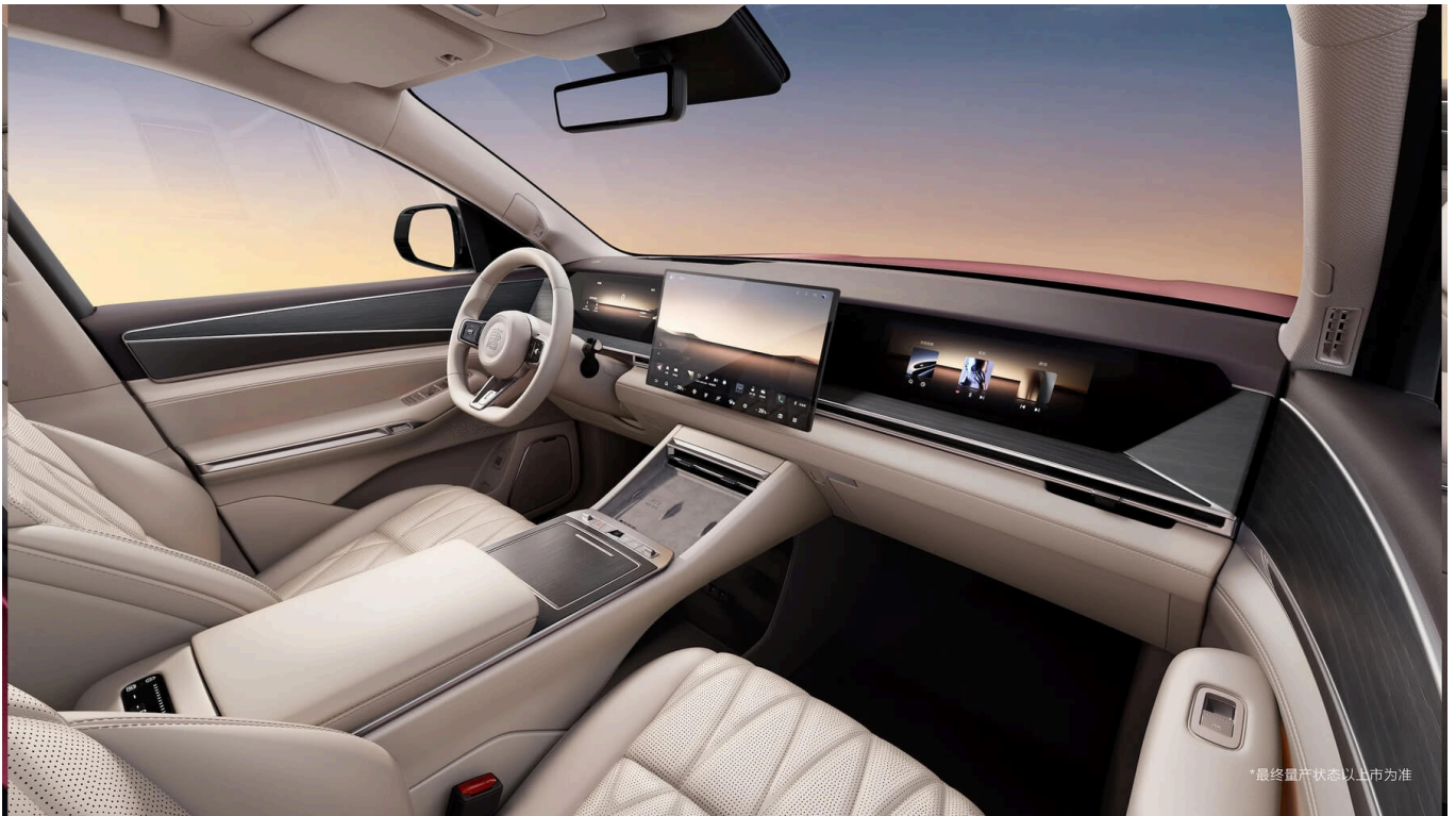
比亚迪三联屏座舱图片