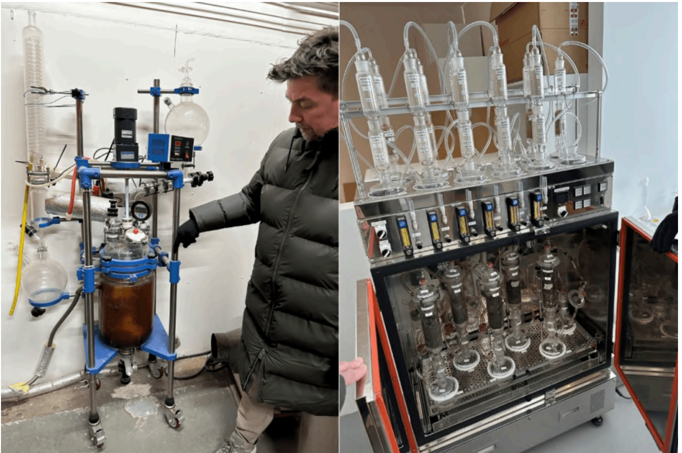
他们最初用于生产第一批保密配方的反应釜，现已实现规模化，在全球多地投入正式生产设备。图中是用于测试材料随时间降解、回归自然情况的设备。

该项目已取得一项落地成果 —— 一款完全以 Pond 生物材料纺制的纱线为原料制成的 T 恤。