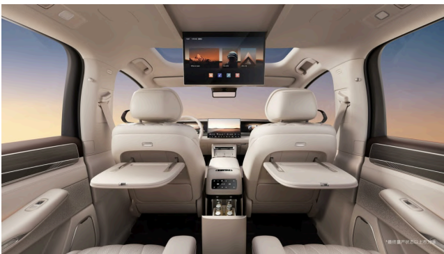
比亚迪大唐纯电旗舰 SUV 内饰