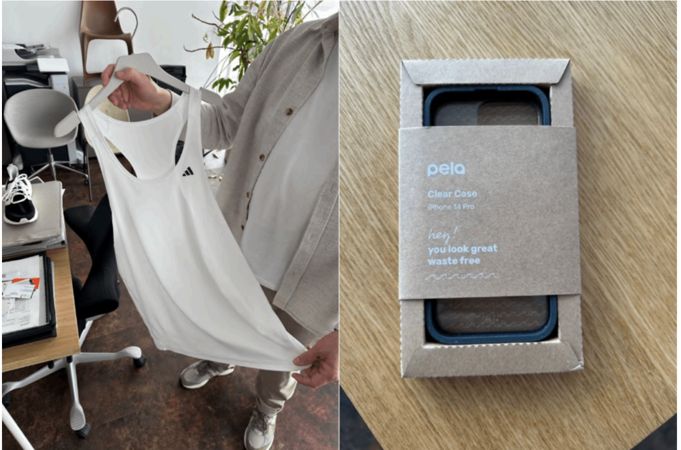
采用POND纱线制作的阿迪达斯运动T恤，以及采用POND材料制作的IPHONE手机壳，特别是该材料中类似透明聚碳酸酯的版本

那么，在适宜的湿度和温度下，细菌最终会不会分解掉汽车内饰？答案是不会。经过思考并与 Thomas 讨论后，他的结论是，车内环境不太可能同时满足降解所需的三个条件。